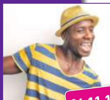
Baltic Open Air 2018 Haddeby bei Schleswig