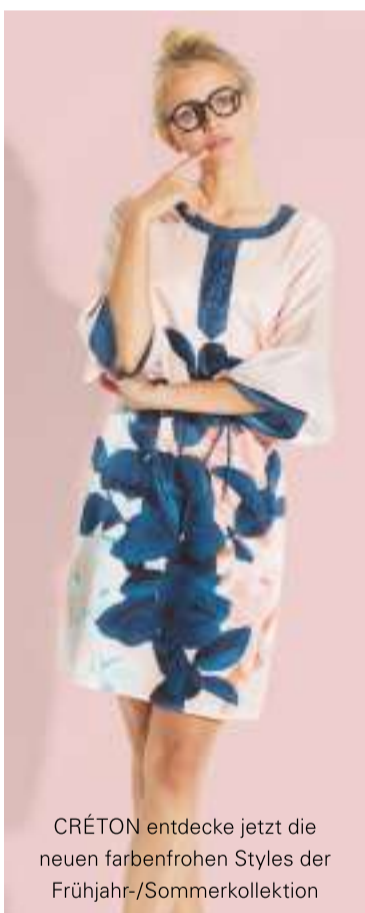
CRÉTON entdecke jetzt die neuen farbenfrohen Styles der Frühjahr-/Sommerkollektion

ARCHITECTMADE »Owl« ab 59,- »Bird« ab 45,- OPENMIND Eule H 9 cm 5,50 KAY BOJESEN Affe ab 70,-