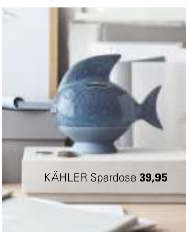
KÄHLER Spardose 39,95

FURNITURE BY SINNERUP »Georgia II« Daybed mit einem Stoffbezug in Gelb oder Grau 200 x 80 x 40 cm 319,50 »Shape It« Metalregale in Rosa, Grün, Blau oder Schwarz ab 25,50 CRÉTON MAISON Samtkissen ab 14,-