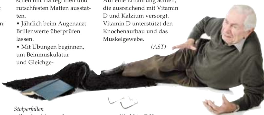
Stolperfallen sollten beseitigt werden.

Auf eine Ernährung achten, die ausreichend mit Vitamin D und Kalzium versorgt. Vitamin D unterstützt den Knochenaufbau und das Muskelgewebe.