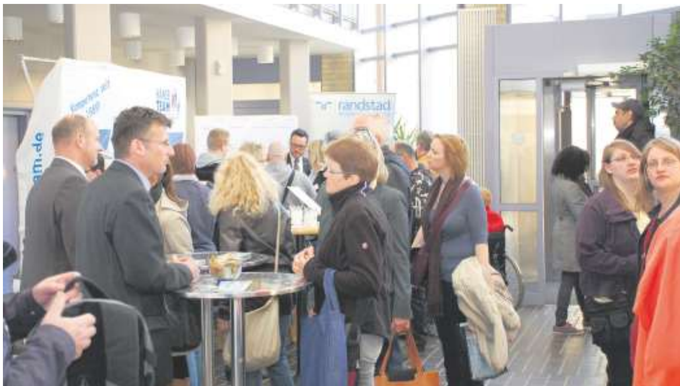
Die Besucher der Zeitarbeitsmesse können sich nicht nur über Beschäftigungsmöglichkeiten informieren, sondern auch direkt ihre Bewerbungsunterlagen abgeben.

Interessierte erhalten hier Informationen über Chancen und Möglichkeiten im Personaldienstleistungssektor. Die Zeitarbeit, ein wichtiger Bestandteil des regionalen Arbeitsmarktes, stellt für viele Arbeitslose, Berufseinsteiger und -rückkehrerinnen eine wertvolle Beschäftigungsperspektive dar und ist häufig ein Sprungbrett zur Festanstellung in einem Unternehmen. Elf Aussteller aus der Region